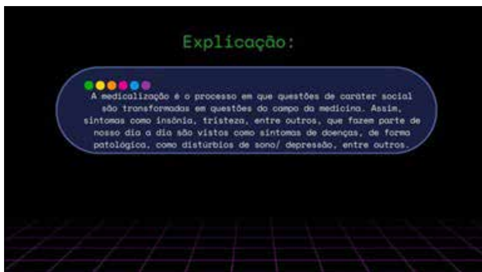
Figura 5. Explicação da questão sobre medicalização - Mitos e Verdades