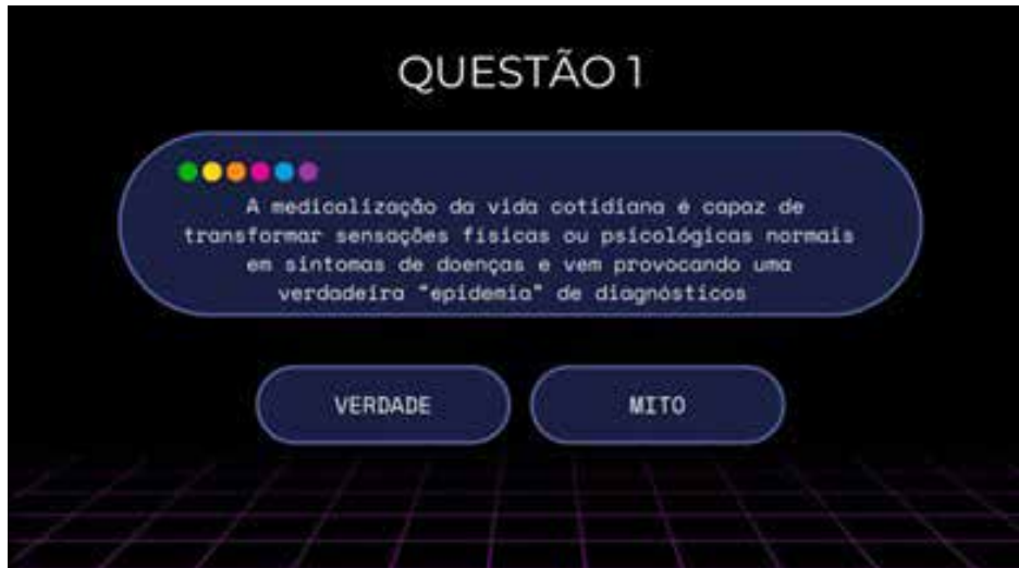
Figura 3. Questão sobre medicalização - Mitos e Verdades